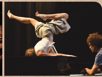
Compagnie Plooc's - 'Plooc's