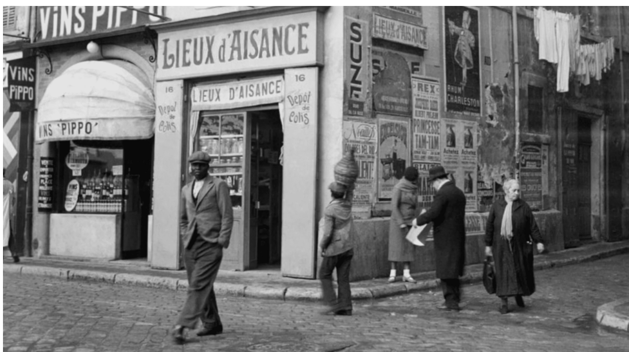
Image d'archive des années 20 à Marseille, extraite du Film McKay, de Harlem à Marseille de Matthieu Verdeil